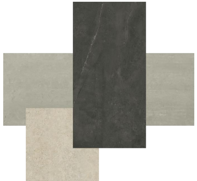
↑高級感のあるポルトガル製タイル

形状が美しいだけでなく実用性も重視し、肩までしっかりお湯に浸かれる浴槽を5型展開します。